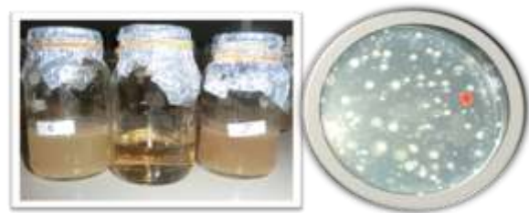
Gambar 2. Konsorsium mikrob pada media cair dan padat a = Mikrob filosfer dan mikrob rizosfer pada media cair, b = Mikrob filosfer pada media nutrisi agar (NA)

Kultivasi mikrob dari sampel daun dan tanah, diperoleh 144 konsorsium mikrob filosfer dan 48 konsorsium mikrob rizosfer. Kultivasi konsorsium mikrob pada media cair dan padat disajikan pada Gambar 2.