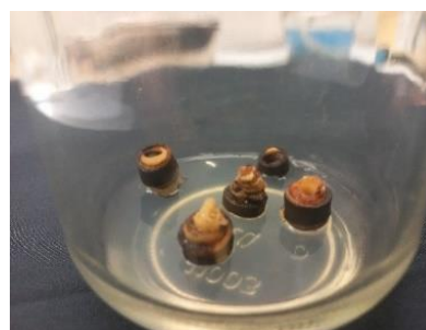
Gambar 1. Perlakuan D2B2 mengalami Pencoklatan ( Browning )

1) Browning diawali dengan adanya perubahan warna eksplan dari hijau dan kemudian berubah menjadi coklat pada daerah pelukaan. Eksplan yang berwarna kecoklatan menandakan bahwa sel-selnya telah mengalami kematian (Sitinjak et al. , 2019) kemudian Ozygit (2008) menambahkan bahwa eksplan yang terpotong menyebabkan kandungan sitoplasma dan vakuola tercampur dan keluar sehingga senyawa fenol dapat teroksidasi oleh udara.